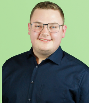
Andreas Peter Listenplatz 15