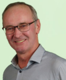
Konrad Kolbinger Buch