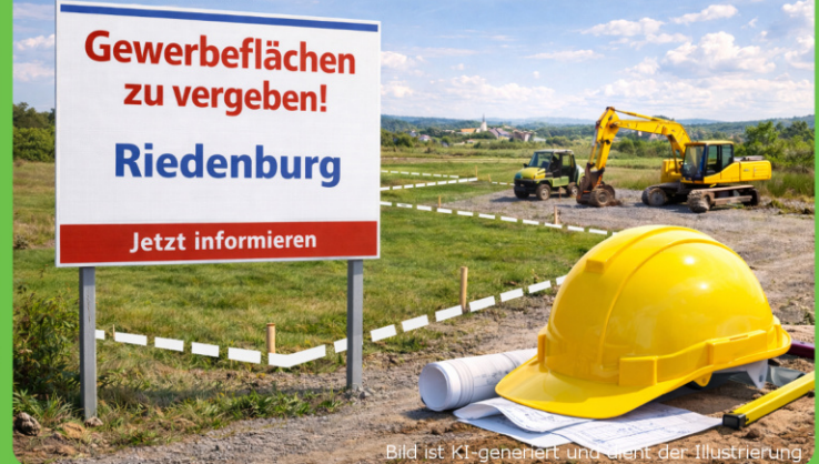
Bild ist KI-generiert und dient der Illustration