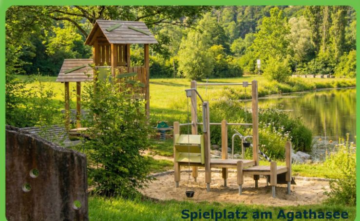
Spielfeld am Agathasee